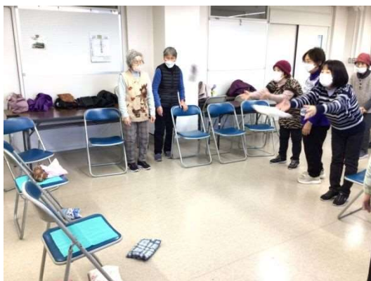
キャップバッグ体操

おしゃべり会では、毎回「けんこうと平和」のクロスワードに取り組んでいます。縦・横のヒントを見ながら考える時間はとても楽しいひと時になっています。「おしゃべり」の名の通り、健康や生活面で気になることなども話題になります。